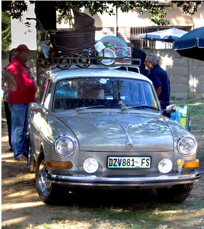
Eddy se Variant

Dankie aan al die eienaars wat julle motors kom tentoonstel het.