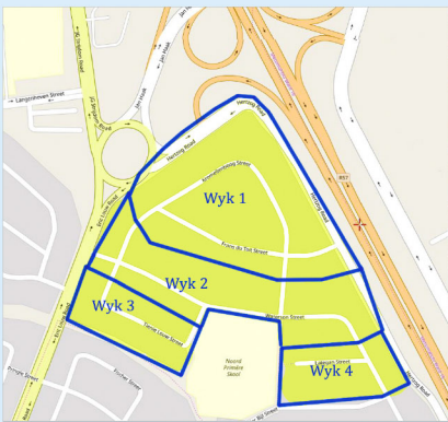
Kaarte van Anker 1

Al die ankergebiede se afbakening begin vanaf ons Gemeente Sentrum (Kerkgebou).